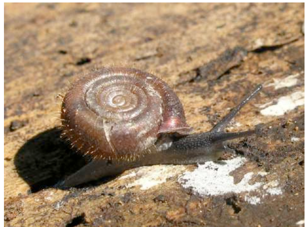
Remarquer les poils sur la coquille