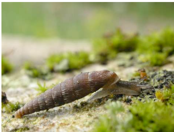
Les lieux moussus et humides sont recherchés par certaines espèces de clausilies, ici la clausilie allongée ( Clausilia bidentata crenulata ).