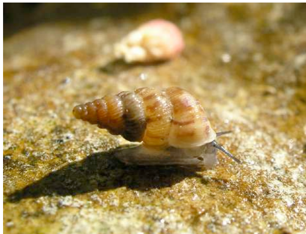
Le cochlostome commun Cochlostoma semptemspirale est le plus répandu des cochlostomes en France. Il vit plutôt dans les endroits humides sur le sol, par exemple sous les pierres ou le bois mort.