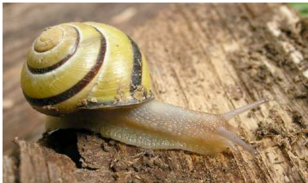
Escargot des haies typique

Ces trois espèces présentent une grande variété de coloration des coquilles, même au sein d'une seule population : tous les individus de la photo de droite ont été collectés sur quelques dizaines de mètres carrés.