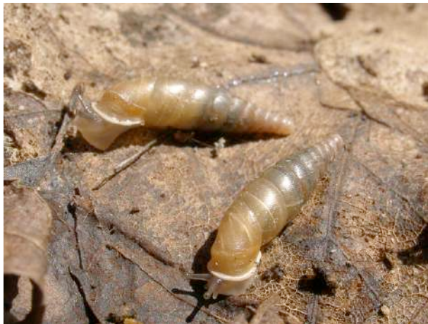
On distingue par transparence les lamelles internes de la coquille.