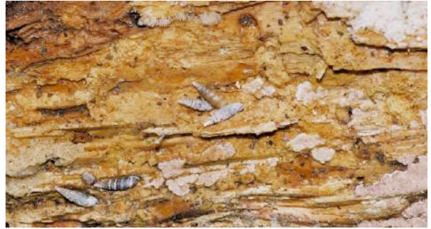
Certaines espèces se rencontrent en nombre sur le bois mort.