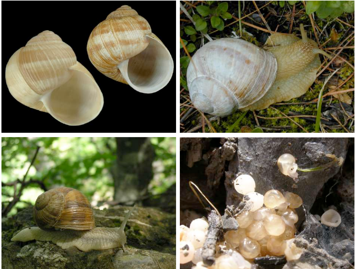
Ponte d'escargot de Bourgogne

Identification : Très grande coquille globuleuse, épaisse, ocre à blanc crème avec des stries d'accroissements. Coquille unie ou avec des bandes spirales très large, parfois indistinctes. Ouverture plus ronde que celle du petit-gris. Dans les bois, les haies, les prairies.