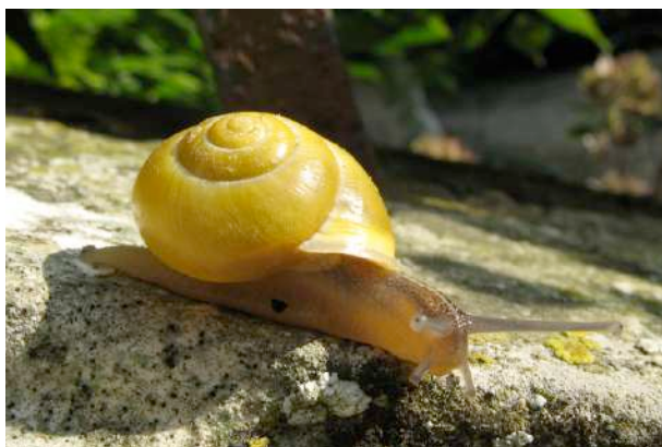
Les bandes peuvent être absentes...