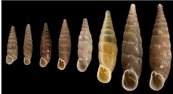
Quelques-unes des 47 clausilies présentes en France. Remarquer la forme caractéristique de la coquille.

Identification : Coquille de taille petite à moyenne, très allongée, toujours sénestre (ouverture à gauche). Forme de quille pour les grandes espèces, d'aiguille pour les petites. Brun sombre à ocre clair, parfois blanche. Ouverture petite et garnie de dents.