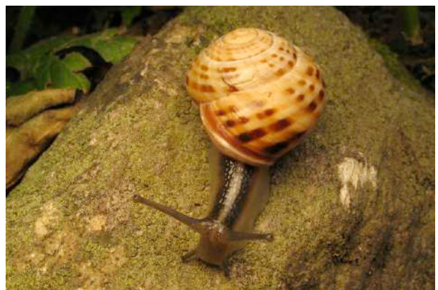
... ou interrompues (escargot des forêts).