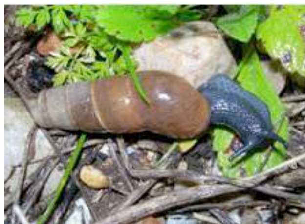
Coquille d'adulte à gauche, de jeune à droite.