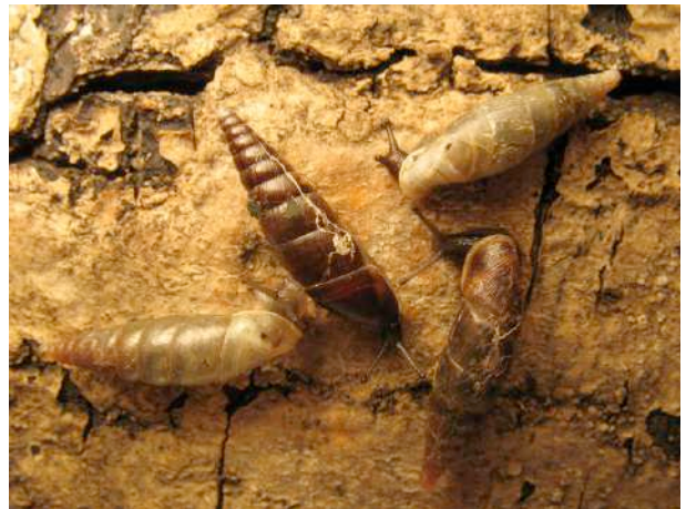
Remarquer la variation de la couleur de la coquille, qui n'est donc pas un critère suffisant pour l'identification.