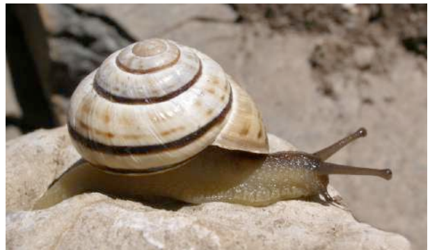
Escargot des forêts