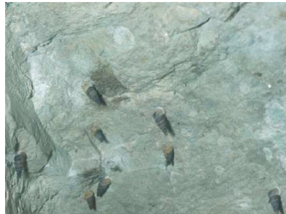
Les cochlostomes se rassemblent parfois en nombre sur les rochers calcaires.