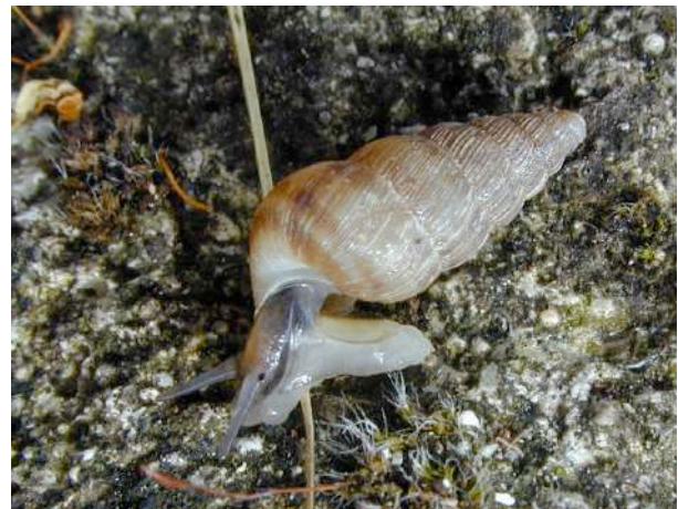
Remarquer l'opercule sur l'arrière du pied et les yeux à la base des tentacules.