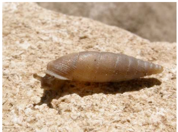
D'autres favorisent les rochers ou les vieux murs (ici la perlée des murailles Papillifera solida )